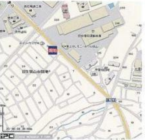
※このハウジングマップは概略紹介です。形状等が現況と異なる場合は現況優先となりますのでご了承ください。