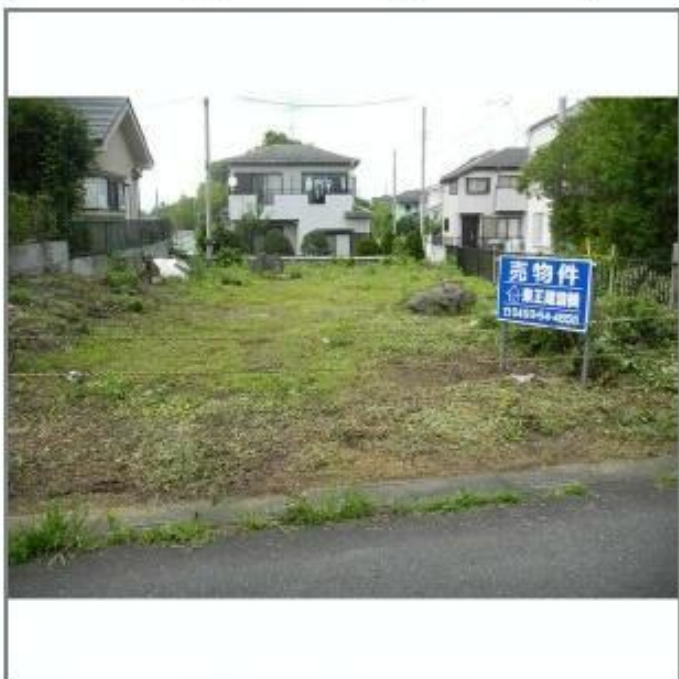
現況写真 南西角より