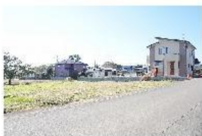
前面道路含む現地写真