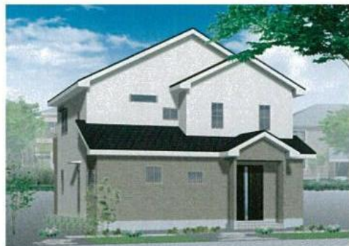
※建物・配置は実際とは多少異なる場合があります。外構は実際とは異なります。植栽は価格に含まれません。サッシ位置及びサイズは、実際とは異なる場合があります。図面と状況に相違がある場合は現況優先とします。