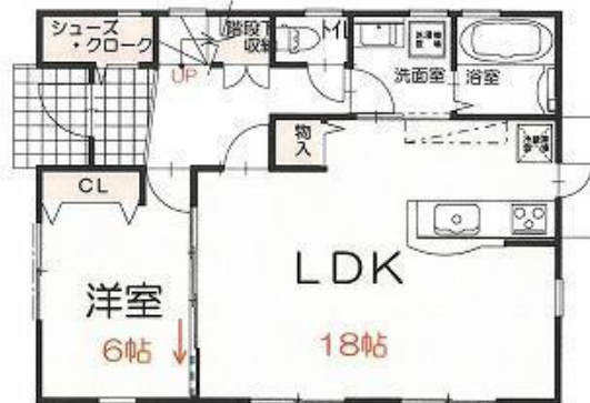
1階平面図 S: 1/120