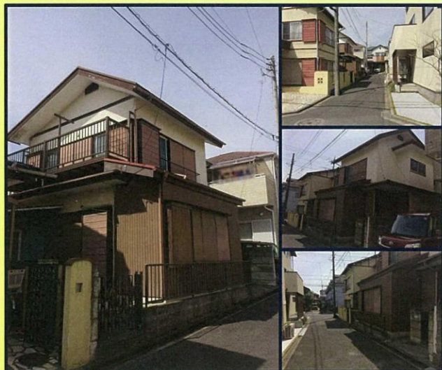
[平成29年3月撮影 物件外観・前面道路]