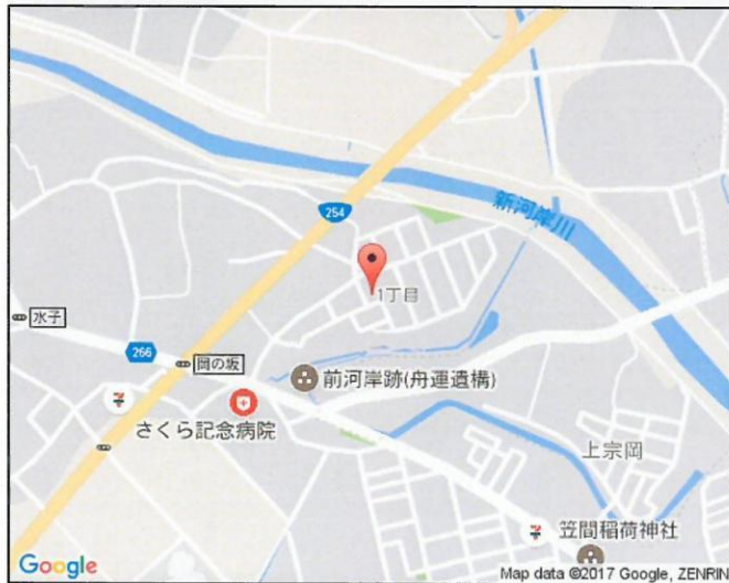
※図面と現況が異なる場合は、現況を優先させていただきます。