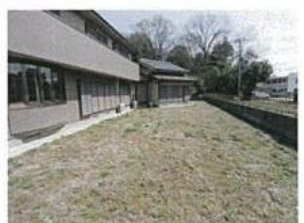
ペットも喜ぶ南西側の広々お庭が魅力