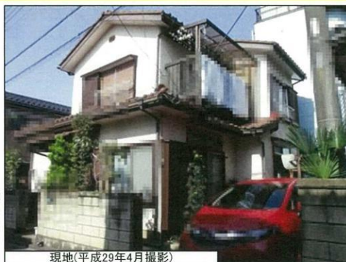
現地(平成29年4月撮影)