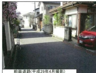
前面道路(平成29年4月撮影)

内見の際は、必ず当社へご連絡下さい。尚、売却済みの場合はあしからずご了承ください。