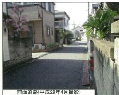
前面道路(平成29年4月撮影)