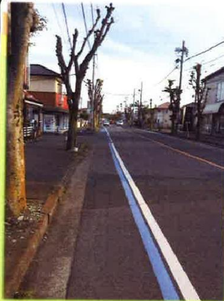
【現地前面道路】平成29年4月撮影