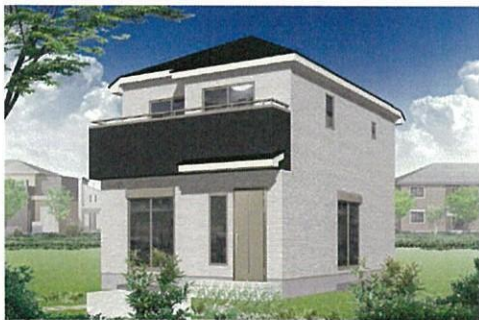
※イメージパースにつき実際とは多少異なります。

□所在地 / 埼玉県川越市大字上戸字山王原274-11他 □交通 / 東武東上線「霞ヶ関」駅徒歩7分 □土地権利 / 所有権 □地目 / 宅地 □都市計画 / 市街化区域 □用途地域 / 第2種低層住居専用地域 □建ぺい率 / 50% □容積率 / 100% □建物構造 / 木造サイディング貼スレート葺2階建 □完成予定 / 平成29年5月下旬 □引渡予定 / 平成29年6月 □接道 / 南側10M公道 □設備 / 東京電力、公営水道、都市ガス、本下水、システムキッチン、1F・2Fウォシュレット、シャワー付洗面化粧台、ヘアガラス、浴室乾燥機付ユニットバス、外構、カーポート □その他 / TVアンテナ(電波障害)によるケーブルTV、共聴アンテナの申込はお客様の負担となります。電気供給の為、敷地内に電柱及び支線が入る場合があります。所有権移転登記手続きにおいて当社指定の司法書士を利用して頂きます。図面と現況に相違がある場合は現況を優先とします。TVアンテナ、網戸、照明器具、カーテンレール、面格子は付きません。※網戸一式別途162,000円(税込) ※表示登記(別途9万円かかります。) ※フラット35ご利用の場合における各証明書取得代金が別途必要になります。 ※価格は全て全総額を表示しております。