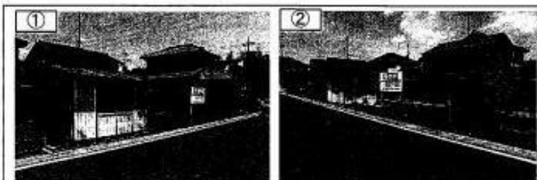
①②外観写真 平成29年6月撮影

内見の際は、必ず当社へご連絡下さい。尚、売却済みの場合はあしからずご了承ください。