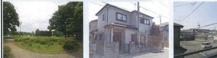
脚折近隣公園まで約190m