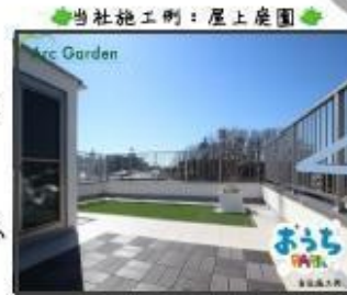
当社施工例：屋上庭園