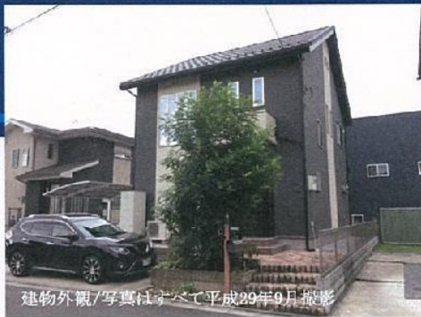
建物外観/写真はすべて平成29年9月撮影