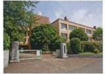
山王中学校まで約540m