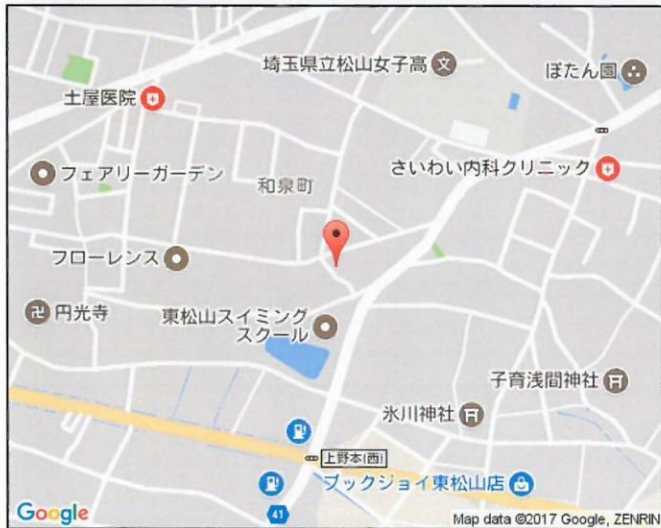
※図面と現況が異なる場合は、現況を優先させていただきます。