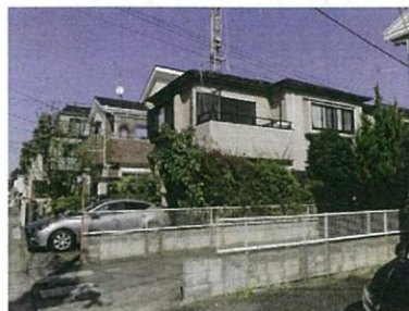
【物件外観・前面道路】