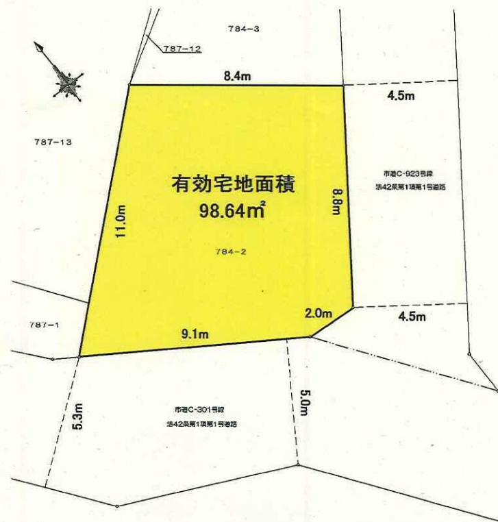
現況図(実測図ではありません)