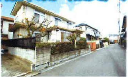
写真上下共に 現地 (古家あり) 平成29年11月撮影