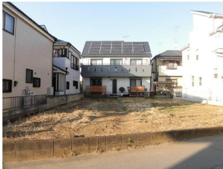
現地写真(平成30年1月撮影)