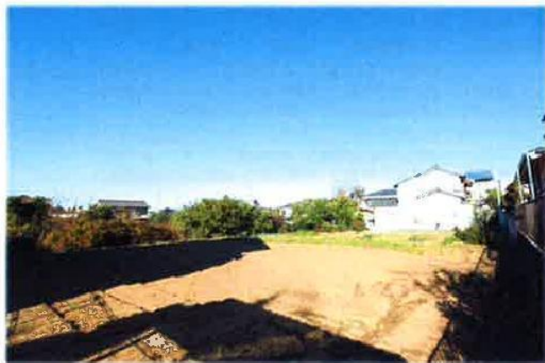
現地/平成29年11月撮影