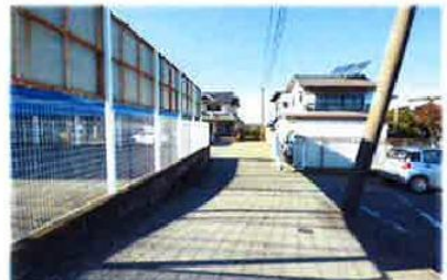
現地前道路/平成29年11月撮影